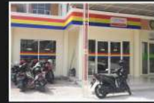
Unit Bisnis Surya Mart UM Surabaya