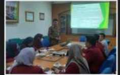
Mini Bank Syariah